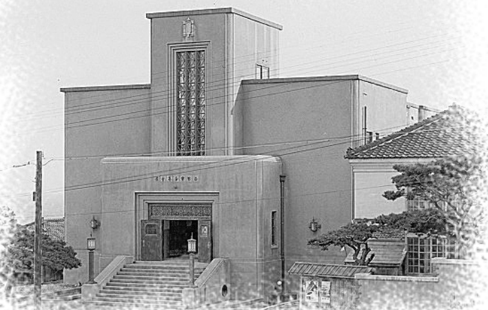
昔の公民館外観